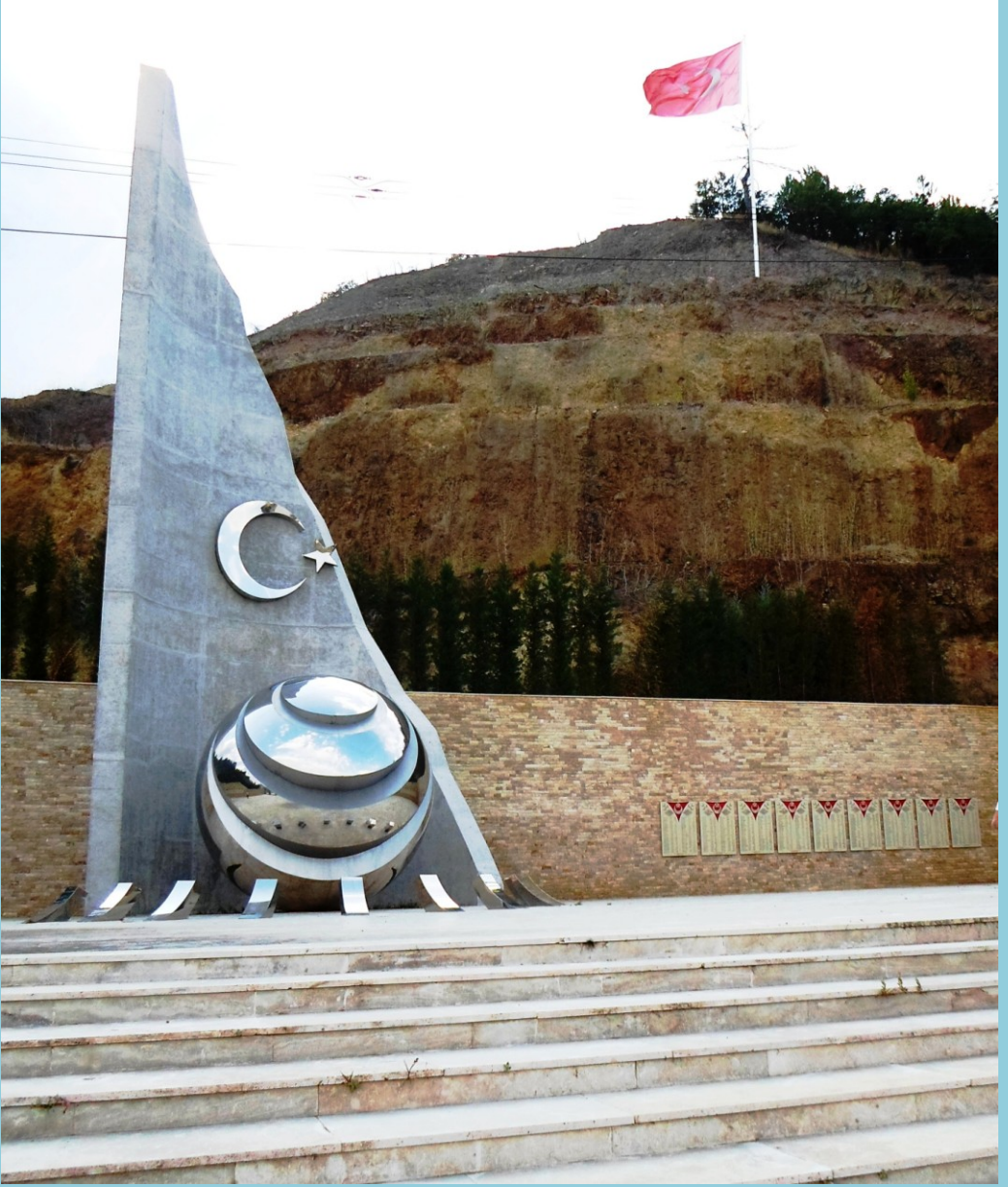
Ülkücü Şehitler Anıtı, Kızılcahamam/ANKARA