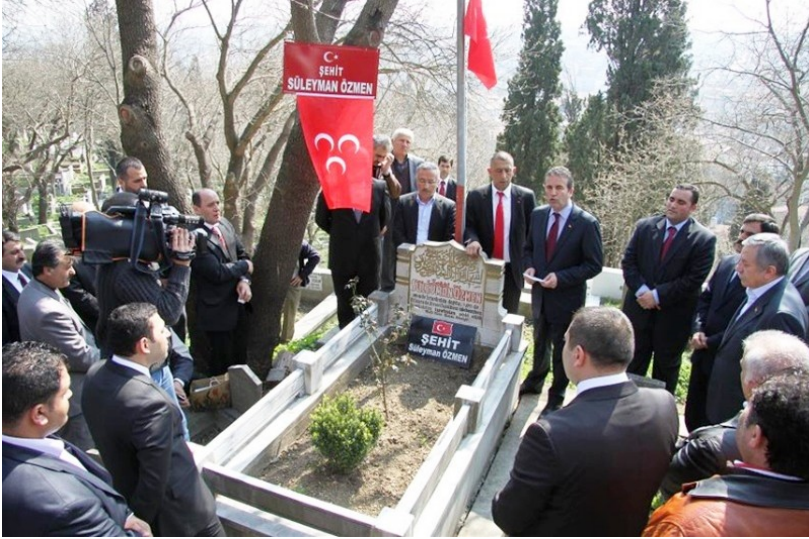
Ülkücüler şehitlerini anarken.

Ülkücüler sadece büyük ve güçlü bir Türkiye istiyorlardı. Anne ve babalarının fedakârlıkla onlara sağladığı imkânları en iyi şekilde değerlendirecek, okullarını başarıyla tamamlayacaklar, meslek sahibi olacaklar, ülkeye ve millete hizmet edeceklerdi. Vatan ve millet sevgisini her şeyin önünde ve üstünde tutuyorlardı.